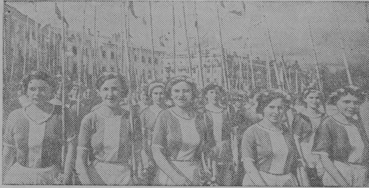
Снимок вылын: „Локомотив“ спортнвöй общество колоннаын.

Июнь 24 лунö Ярославын чулötчис ыджыт физкультурнöй парад, көдя посвятитöм РСФСР Верховнöй Советö бöрийм годовщиналö. Парадын примитöй участие г. Ярославись да Ярославскöй областись 10 тысяча мымда физкультурник.