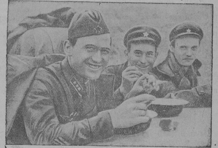
Снимок вылын: Заозерной высота дынын бой бэрын командной составлн завтрак. Фото снимок кером Хасан озеро районн "Правдалон" специальной корреспондентон В. Теминон (1938 г.).

Хасан озеро районн война провокаторрезисэ—японской самурайезисэ—разгромитомлн годовщина кежэ.