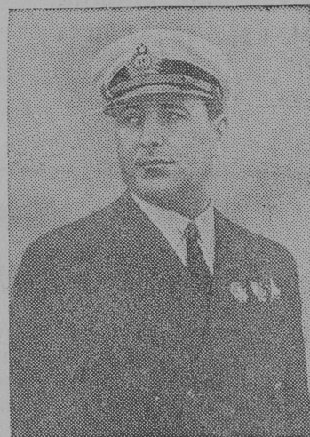
Советскöй Союзлөн Герой—подводник, ёрт ЕГИПКО.