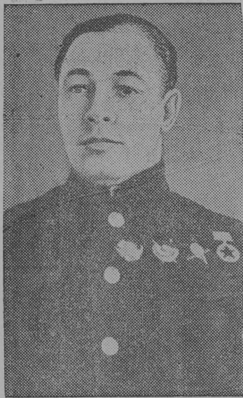
Снимок вылын: СССР Военно-Морскöй Флотлөн Народнöй Комиссар ёрт Н. Кузнецов.

Гражданскöй война коста Краснöй Армиянь служитöм и Краснöй Армия понда гражданскöй война бöрын уджалöм, ме понда, кызд крестьянскöй зонлө, вöли пыр медприятнöйөн. Приятнöйөн с и й ö н, что Краснöй Армия—миан родвöй армия—плоть плотсьянь, вир вирсянь рабочöйезлөн да крестьяналөн. Краснöй Армия бережитны Октябрьскöй революциялись завоеваннөез, мянлись донавожддезöс, бережитö мянлись роднöй правительствöс и быдöс 170 миллионнöй трудовöй народöс. Краснöй Армия бережитö мирнöй труд рабочöйезлись да колхозниккезлись, бережитö передовöй наукаёс, передовöй советскöй куль-