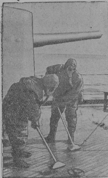
Снимок вылын: „Неприятельскй“ самолеттэз налет бōрын палубае дегазацируйтōм.