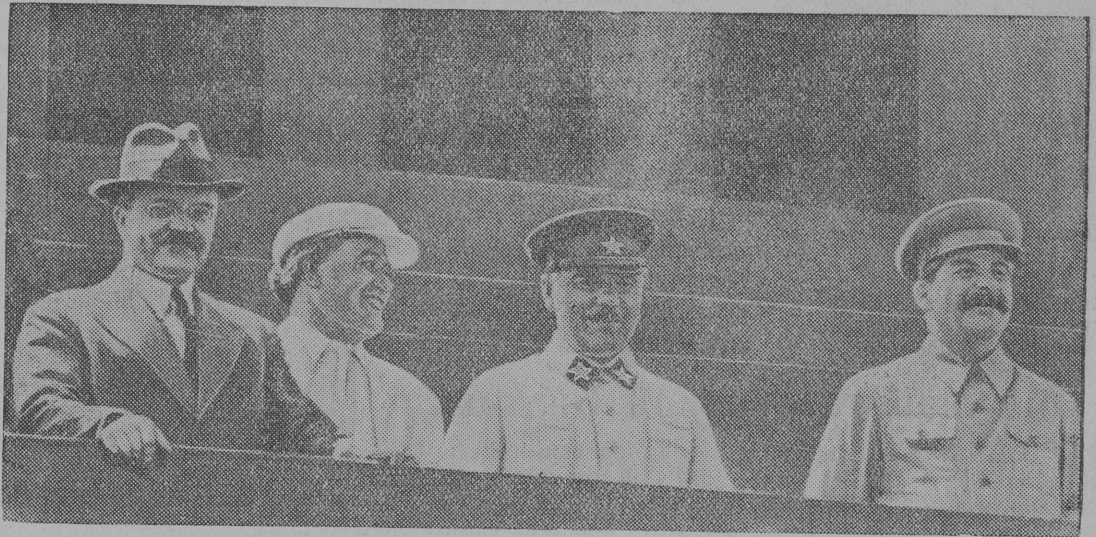
Товарищи: Сталин, Ворошилов, Дамитров и Молотов на трибуне мавзолея.