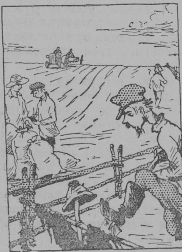
...т. к. его приусадебный участок глубоко врезался в колхозное поле