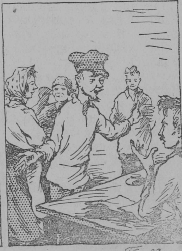
... когда получали аванс