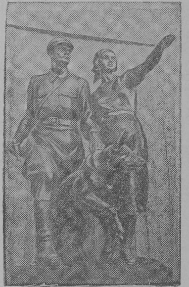
На снимке: Скульптура „Пограничник и колхозница“, установленная у входа в павильон Белорусской ССР.

На Всесоюзной сельскохозяйственной выставке.