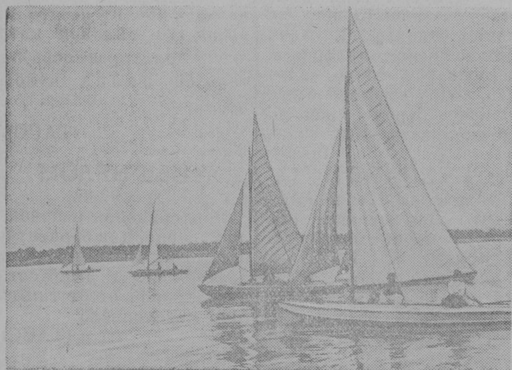
На снимке: Спортсмены Сталинградского спортивного общества „Трактор“ на парусных яхтах на Волге.