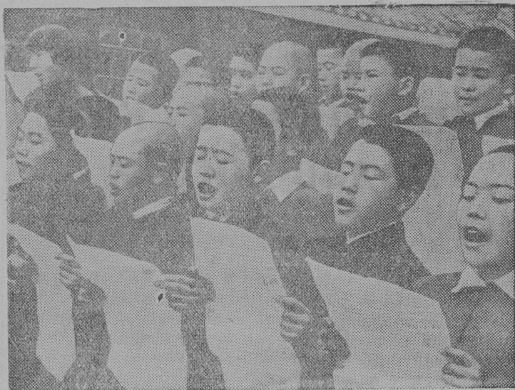
На снимке: Ребята в детском доме разучивают одну из революционных песен китайского народа.

Проявляя большую заботу о детях бойцов китайской армии и о детях-беженцах, оставшихся без крова и без родителей, китайский народ организует детские дома.