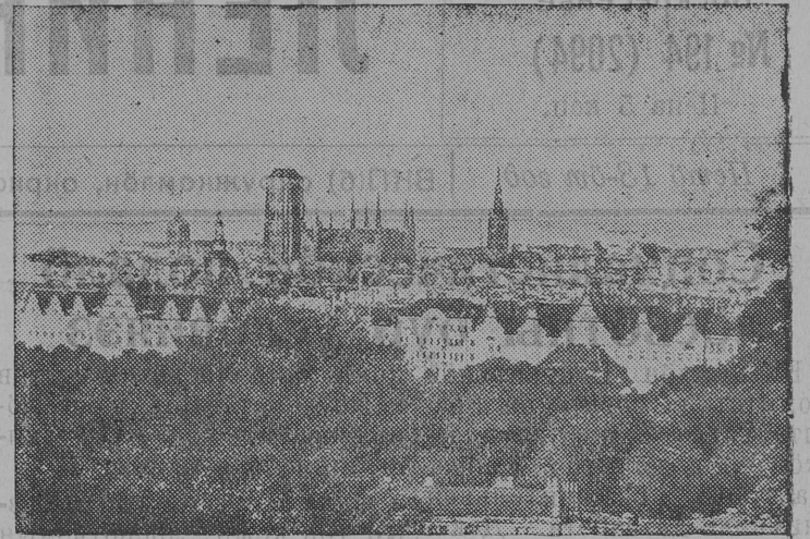
Снимок вылын: город Данциглон обшбй вид.