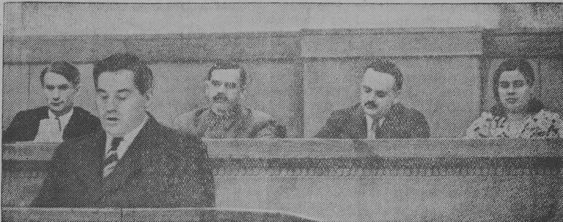
СОВМЕСТНОЕ ЗАСЕДАНИЕ СОВЕТА СОЮЗА И СОВЕТА НАЦИОНАЛЬНОСТЕЙ.