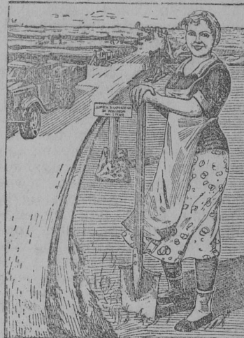
„СТАЛЬНАЯ КОННИЦА“ БРИГАДА-ЛЕННА БИРМА ЧИСТЫ СЕЛСКОГО НАСЕЛЕНИЯ В СТРОИТЕЛЬСТВЕ И РЕМОНТЕ ДОРОГ

Париж, сентябрь 13 лун. Газета „Пти-паризьен“ юбртб, что Испанской правительство мбдб чожа подшитны дружба йылсь па Франциякбт. (ТАСС).