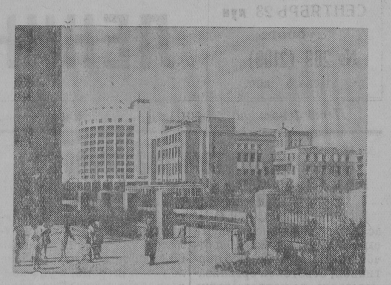
НА СНИМКЕ: Улица Ленина в Свердловске.

За годы Сталинских Пятилеток г. Свердловск превратился в один из крупнейших промышленных и культурных центров страны.