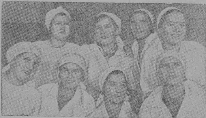
На снимке: Группа стахановок-комсомолок фабрики „Красный Октябрь“ (Москва) изучивших винтовку и изучающих сейчас пулемет.

Обсудитөм вопросэз сьорт ВКП(б) окружкомлөн пленум примитисе соответствующой решеннеэз.