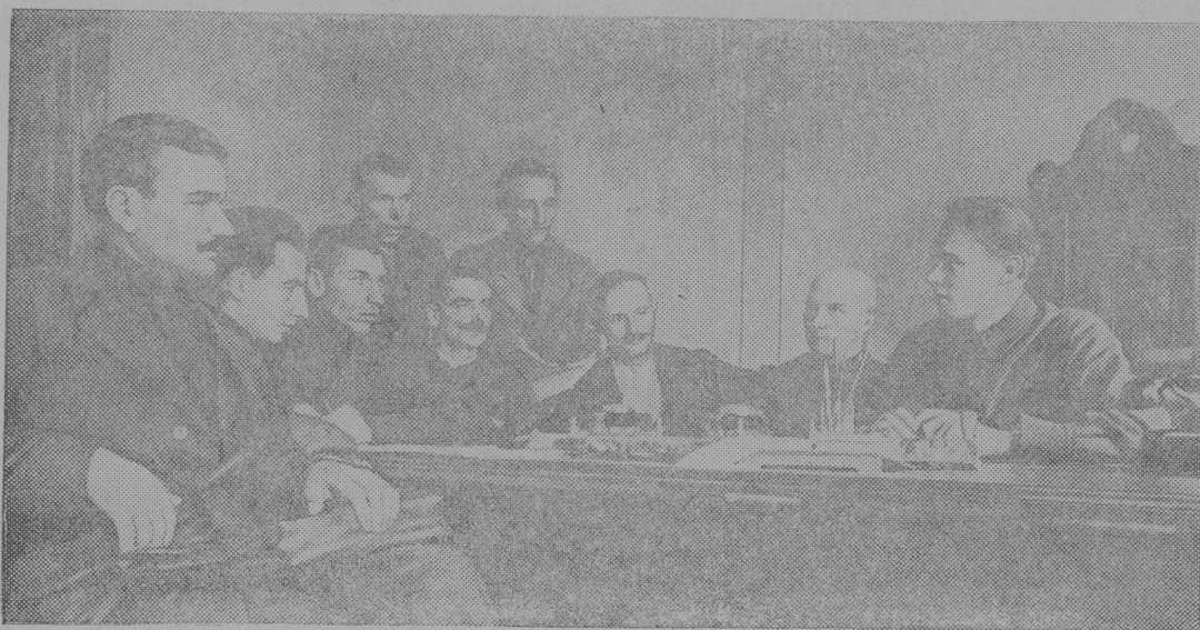
На снимке: Первое совещание председателей крестьянских комитетов при Гродненском городском Временном Управлении.