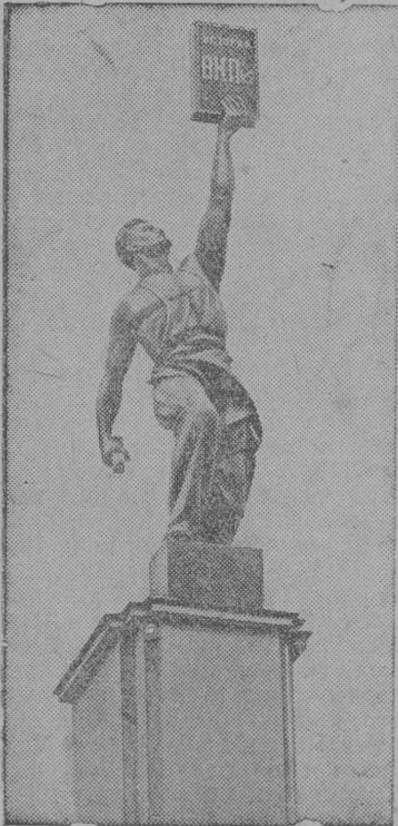
Скульптура, установленная у павильона печати на Всесоюзной сельскохозяйственной выставке.