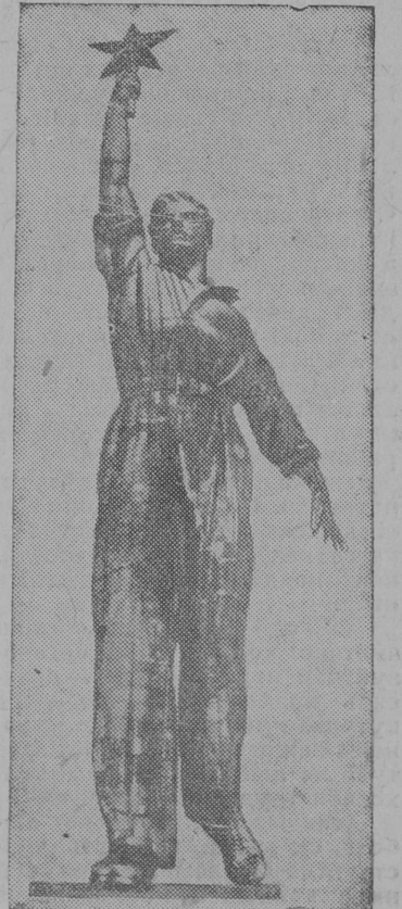
Скульптура из нержавеющей стали у павильона СССР на Всемирной выставке в Нью-Йорке

(Колхозниккеслөн—ударниккеслөн первой Всесоюзной с'езд вылын речись).