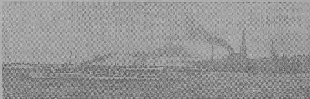
На снимке: Эскадра советских кораблей на Таллинском рейде.