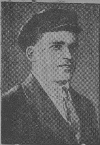
На снимке: С. М. Киров—член революционного Военного Совета XI армии (1920 год)