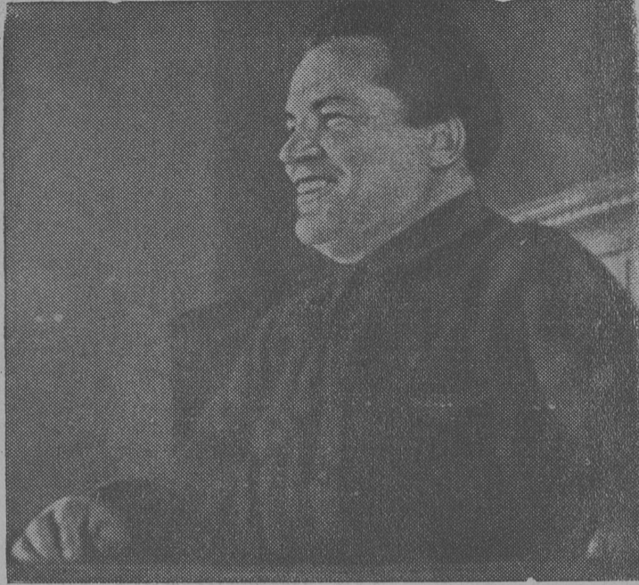
На снимке: Выступление С. М. Кирова на 17 съезде ВКП(б) (1934 г.).

...Мы, партия и рабочий класс, поставим памятник Сергею Мироновичу в деле социализма, в победном шествии коммунизма вперед“.