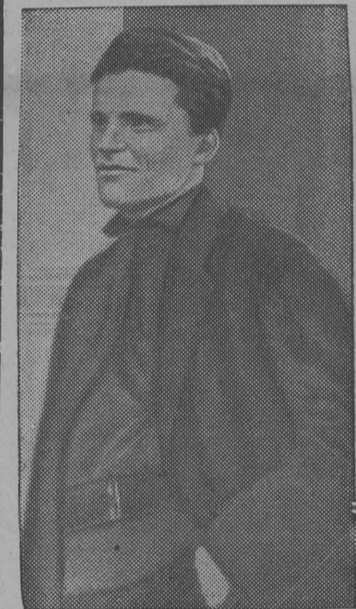
На снимке: С. М. Киров (1910 г.).