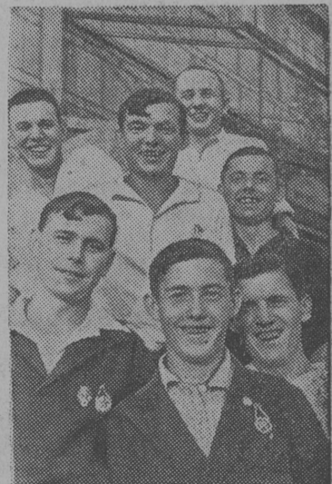
На снимке: Группа комсомольцев призывников цеха № 2.

За хорошую организацию оборонной работы, комсомольской организации механического цеха № 2, Кировского завода (Ленинград), вручено боевое знамя Шанхайского комсомола.