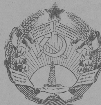
Азербайджанской Советской Социалистической Республикалөн герб.