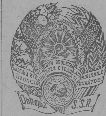
Киргизской Советской Социалистической Республикалөн герб.