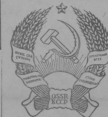
Казахской Советской Социалистической Республикалөн герб.