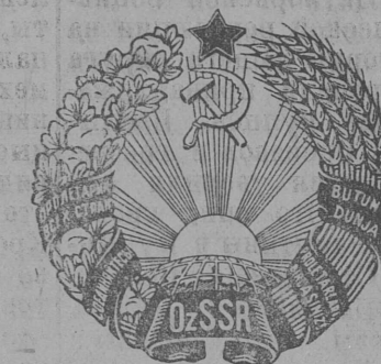
Узбекской Советской Социалистической Республикалөн герб.

Му, кёдэ занимайтёны колхозэз, закрепляйтёны сайо вечной пользованнё, мёднёдж кё шуны—век-кежё.