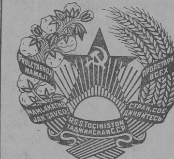
Таджикской Советской Социалистической Республикалөн герб.

Товарооборот округын 1925 голё округын вёлёс только 119 торговый точка 2 миллион 400 тысяча руб товарообороты. 1939 голын округ тавэтыя уджалёны 400 торговый точка 100 миллион голё товарообороты.