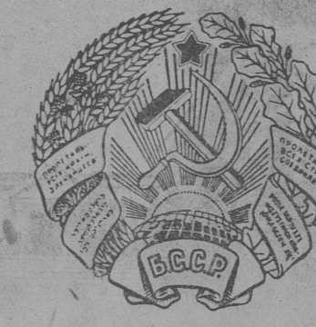
Белорусской Советской Социалистической Республикалөн герб.