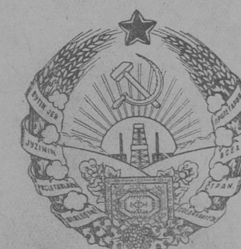
Туркменской Советской Социалистической Республикалөн герб.