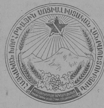
Армянской Советской Социалистической Республикалөн герб.