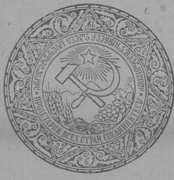
Грузинской Советской Социалистической Республикалөн герб.