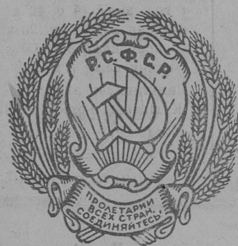
Российской Советской Социалистической Республикалөн герб.