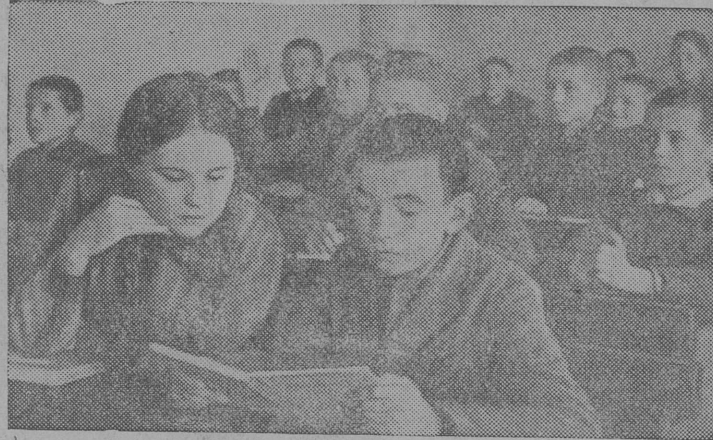
На сьемке: На уроке родного языка в школе города Двинь.