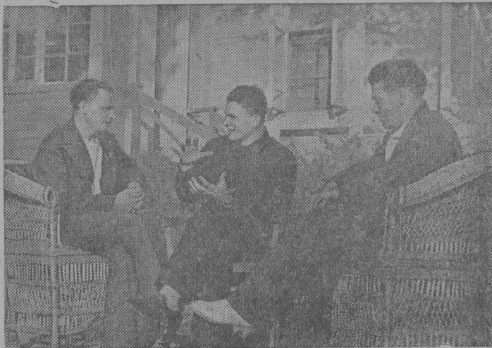
На снимке: Знатные стахановцы котельного цеха судоремонтного завода имени X годовщины Октябрьской Революции (Астрахань) систематически выполняющие норму на 300 процентов.