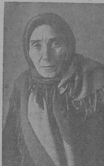
Подготовка к выборам в местные Советы депутатов трудящихся.

Местной Советтээд бөр-ьян лунодз кольччис кад не уна. Колб был доверенной лицолб, агитаторлб кутчын агитационной удж бердб, организуйтны сийб буржыка. Кузнецов.