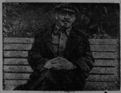
На снимке: В. И. Ленин на отдыхе в Горках (1922 г.). (Центральный музей В. И. Ленина).

21 января исполняется 15 лет со дня смерти великого учителя и гениального вождя пролетариата Владимира Ильича Ленина (Ульянова)