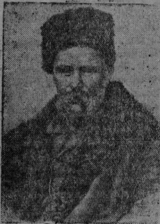
На снимке: Тарас Григорьевич Шевченко (1814—1861) великий украинский поэт, талантливый живописец и гравер.

К 125 годовщине со дня рождения великого украинского поэта-революционера Т. Г. Шевченко.