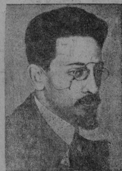
На снимке: Я. М. Свердлов

тия направляет Свердлова на Урал, где он в течение ряда лет работал сначала под кличкой «Андрей», а потом—«Михаил».