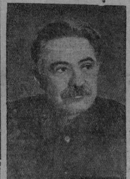
На снимке: Д. З. МАНУЛЬСКИЙ

Отчетный доклад делегации ВКП(б) в ИККИ, сделал на XVIII с'езде ВКП(б) тов. МАНУЛЬСКИЙ.