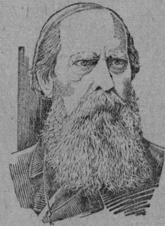
М. Е. Салтыков-Щедрин. Рисунок художника К. Теодоровича. Бюро-книжка ТАСС.

К 50-ти—летию со дня смерти (10 мая 1889 г.) величайшего русского писателя—сатирика М. Е. Салтыкова-Щедрина.