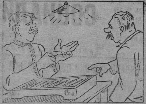
— Почему ты на пальцах считаешь? Ведь на счетах удобнее. — На счетах я доходы от личного хозяйства подсчитываю, а для подсчета трудовой у меня пальцы хватают. Рис. В. Лисевича.