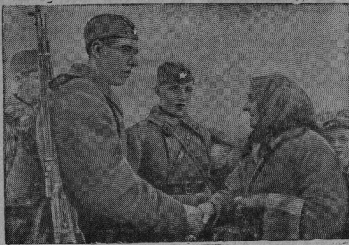
На снимке: Старат крестьянина приветствует бойцов и командиров (м. Молодечно).