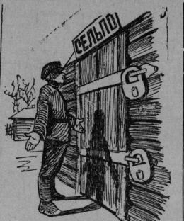
— Опять тут замки висят? Из-за них у меня нет замка для колхозного амбара. Рис. Левченко по теме Б. Анфилова.