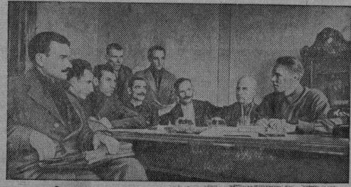
На снимке: Первое совещание председателей крестьянских комитетов при Гродненском городском Временном Управлении.