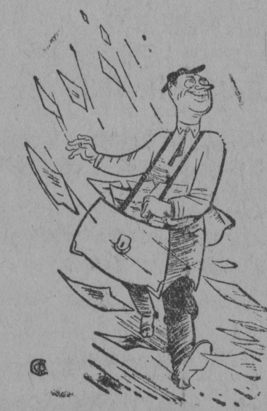
Gainskъj VLKSM rajkom rasprostranjta direktivъez poliţvelatçьm jьliş.

Zik etnas umelik volеjbolnъj ploşadka, kьtçъ soççisъn lunnezъ loktъ tom oşir i suvtъ oçeredъ. Zalajtam vь şetnь norma-