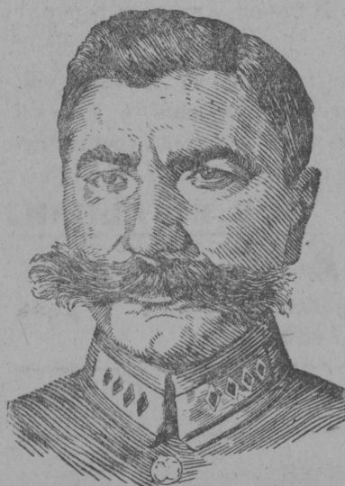
Маршал Советского Союза С. М. Буденный.

21. Бусова Дарья. Ученица 1-го класса. Имеет 6 отметок „отлично“, 3 „хорошо“.