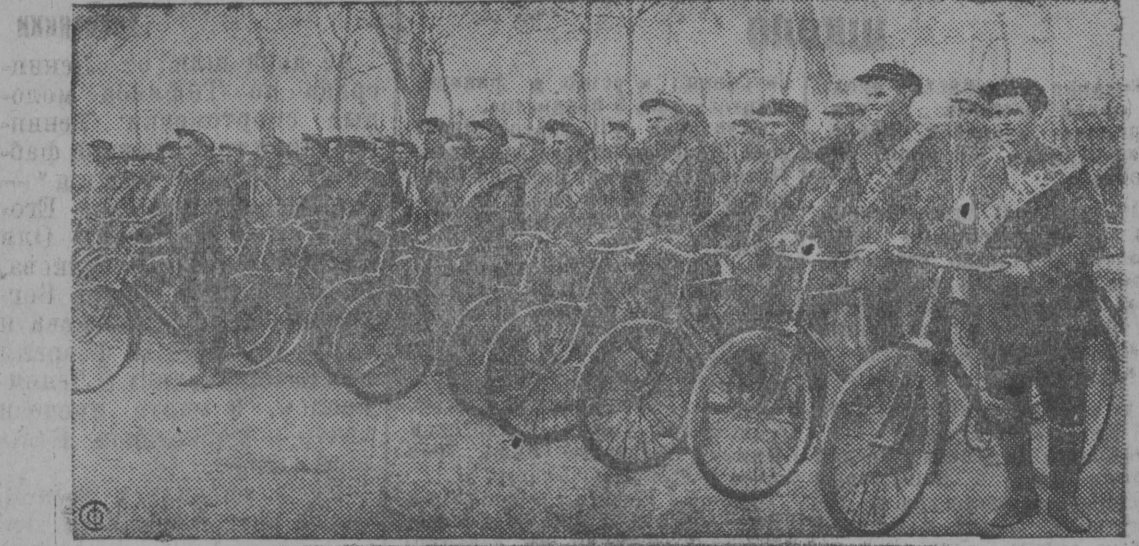
В прошлом году колхозники станицы Старо-Титаровской Темрюковского района Азово-Черноморского края добились хороших урожаев. На доходы, полученные по трудодням, колхозники приобрели много предметов личного пользования в том числе велосипеды. В настоящее время в станице Старо-Титаровской у колхозников насчитывается 370 велосипедов. На днях райсовет Физкультуры организовал в станице колхозный велопробег по маршруту: Старо-Титаровская—Ахтонизовская—Темрюк—Старо—Титаровская. В велопробеге приняли участие свыше 60 лучших производителей стахановцев—колхозников. НА СН: УЧАСТНИКИ ВЕЛОПРОБЕГА В ГОР. ТЕМРЮК.