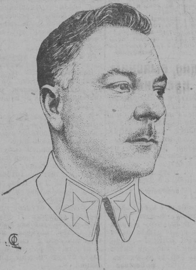
Народный комиссар обороны Маршал Советского Союза Тов. К. Е. ВОРОШИЛОВ

ющих Уральских заводских красных войск, надо найти новые революционные способы тотчас включить этих рабочих в войска для отдыха уставшим и для отпуска на Юг. Первую часть телеграммы сообщите полкам.