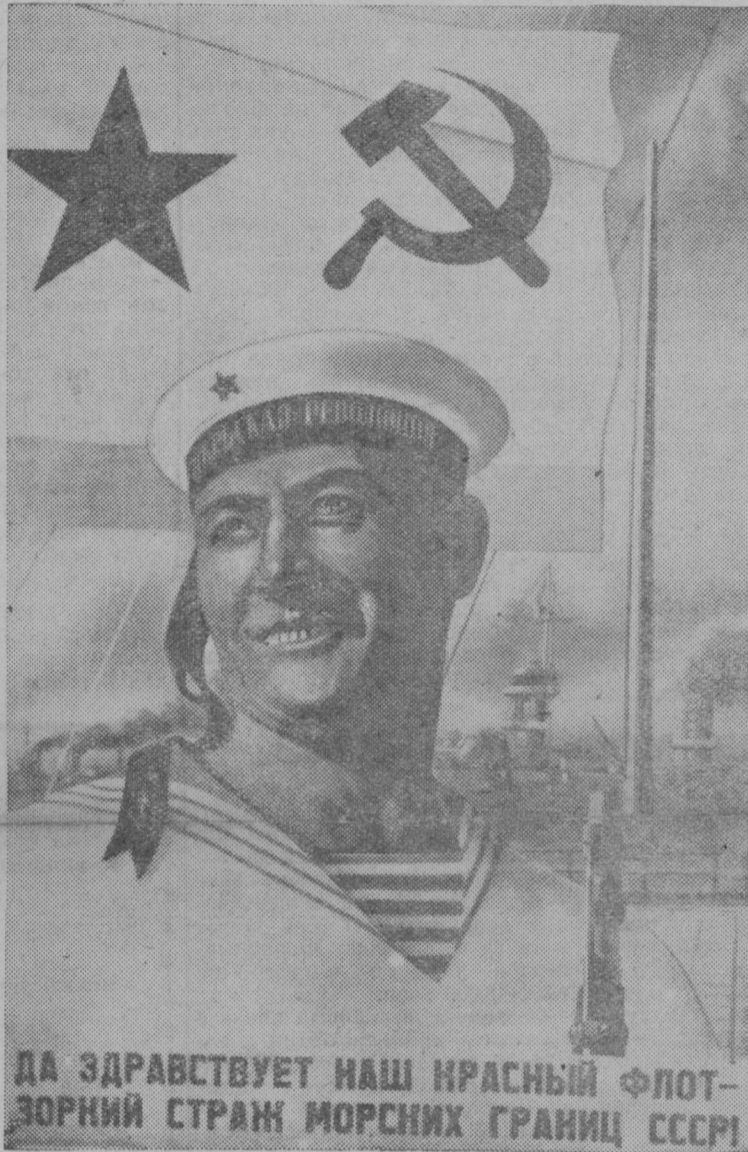
ДА ЗДРАВСТВУЕТ НАШ КРАСНЫЙ ФЛОТ—ЗОРКИЙ СТРАЖ МОРСКИХ ГРАНИЦ СССР!

Миян военнӧй моряккес воспитывайтчӧны русскӧй флотлӧн славнӧй боевӧй традицияэз вылын. Краснофлотецез, командиррез да политработниккес энӧ славнӧй боевӧй традицияэзсӧ свято берегитӧны и, кыдзи враг пешлӧяс сӧрпӧсь чуксӧ сюйшыны миян морскӧй граница пыр, Рабоче-Крестьянскӧй Военно-Морскӧй Флот сийӧ уничтожитас.