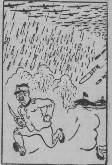
ВКП(б) XVIII съезд вылын ерт Мехлис висывалис:

„Быдос мир выло скандалитчом борын японской военщина пондис выкручивайтчыны. Эд колис кызко асланыс страна одзын отчитайтчыны. И вот асланыс газетаезын сия пондис гижны, что с ыло мешайтис эрок. Но сия населенло эз висывав токо кытшом зер йылис мундо речь. Советской территория выло кольччыны сыло забылис мешайтис зер, токо свиндой, кода локтис ворошиловской залпезсянь“.