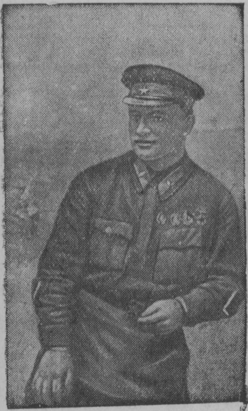
Снимок вылын: Советской Союзлон Герой комбриг П. В. Рычагов Хасан ты дынса районн. Фотоснимок кером Хасан ты дынса районн; керис „Правдалон“ специальной корреспондент ерт В. Темин (1938 г.). Ерт Рычагов самурайезе громитико руководитис Советской Авиацияон.

„Отк кок пидос паста йоз му оз ков. Но и ассиным му, отк вершок ассиным му ог сето некинло“. (СТАЛИН)