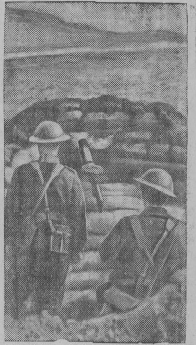
Пулеметное гнездо на одной из дорог в Англии.