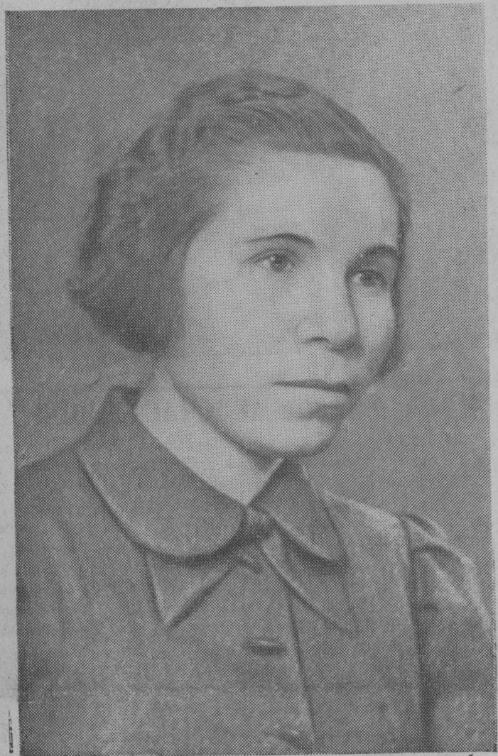
Депутат Верховного Совета СССР М. С. Баталова.