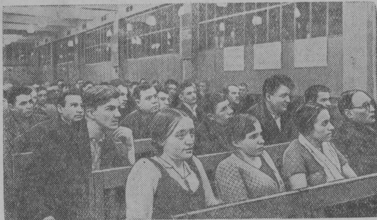
Отчетно-выборное собрание цеховых партийных организаций на заводе имени Сталина (Москва). Партсобрание в литейном цехе № 3.