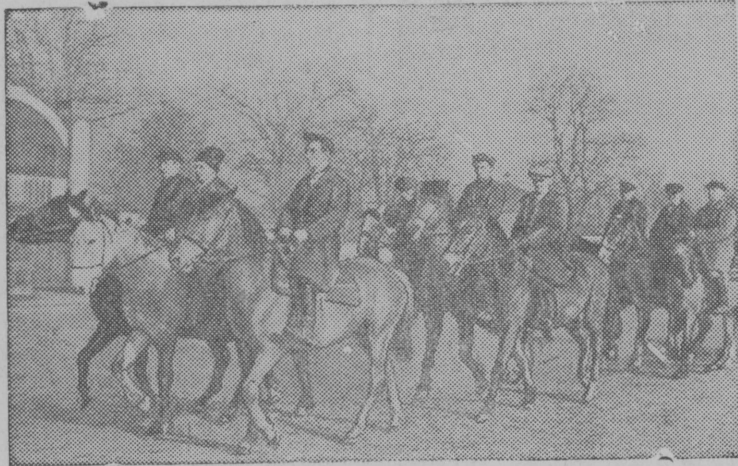
Ворошиловские всадники колхоза им. Чапаева (Золотоношский район, Полтавской области) на тренировке.

ВЛКСМ окружком май 8 лунся решеннõын об'яжитис ВЛКСМ райкомезõс быд ВЛКСМ райком пленум вылын обсуждайтны комсомольскõй организацияез быдмõм йылись вопросез. Этõ решеннõсõ колõ тыртны.