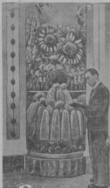
ВСЕСОЮЗНӧЙ СЕЛЬСКОХОЗЯЙСТВЕННОЙ ВЫСТАВКА ВЪЛЫН „Сибирь“ павильонлӧн вводнӧй залын технической культуразлӧн стӧнд.

Пешнигортскӧй сельсоветись „Иньвасай“ колхозлӧн председатель.