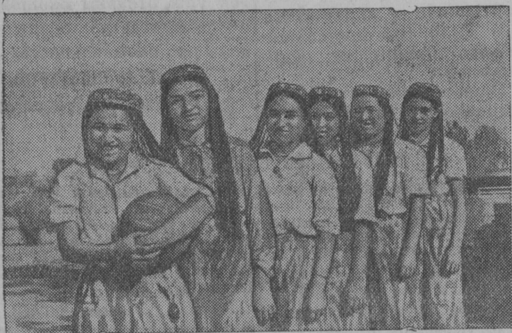
Колхозись ныв-иннезлӧн волейбольной команда.