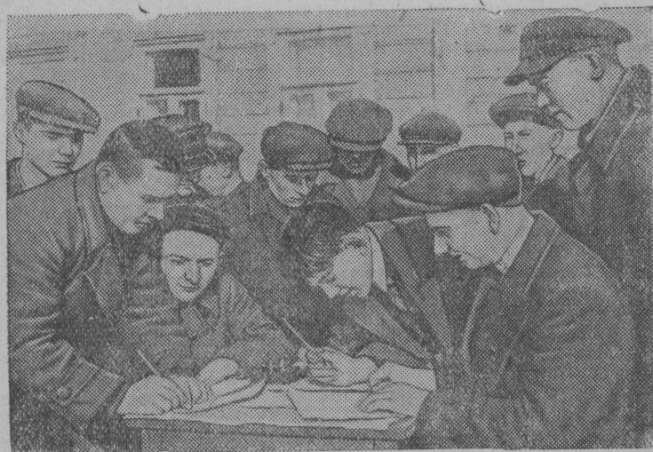
Московскӧй областись, Ленинскӧй районись Горький нима колхозын колхозниккез гижшӧны Куимӧт Пятилеткалӧн нельӧт голса выпуска Заем вылӧ.