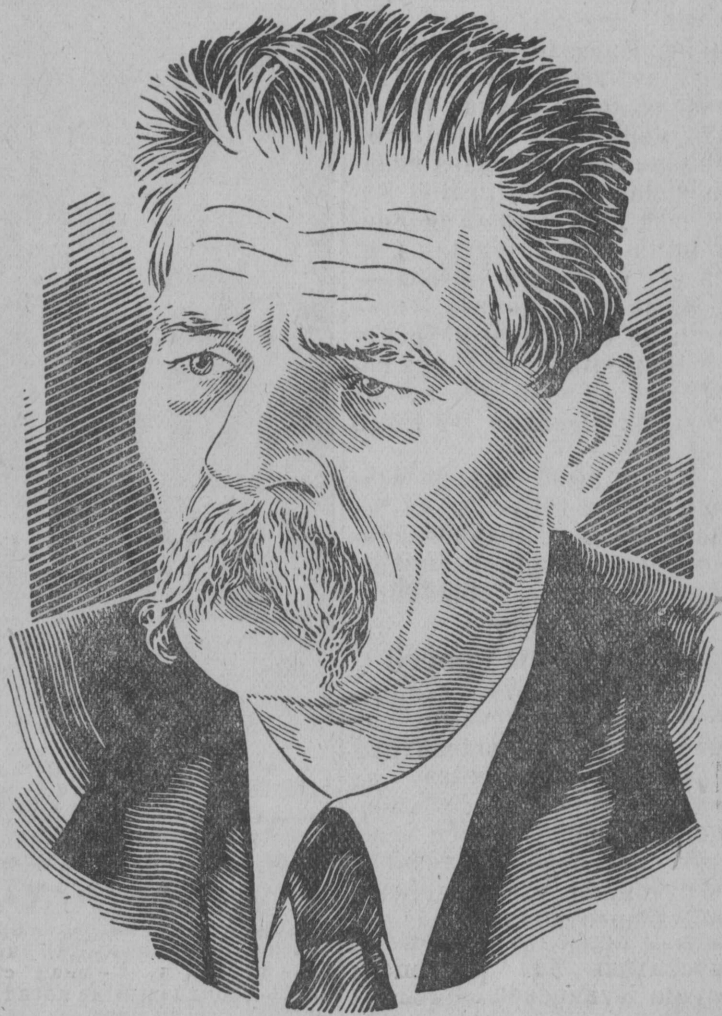
Алексей Максимович Горький.