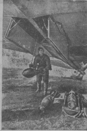
Перед боевым вылетом.