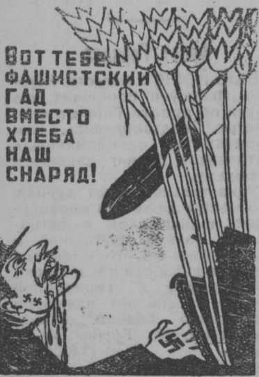
Плакат работы художника М. Китизарьяна.

2 августа 1941 года в Вашингтоне состоялся обмен нотами между послом Союза ССР в США т. К. А. Уманским и исполняющим обязанности государственным секретаря США г. Сомнером Уэллесом о продлении действующего между СССР и США торгового соглашения, сроком на один год, до 6 августа 1942 года. Одновременно г-н Уэллес вручил т. Уманскому ноту об экономическом содействии Союзу ССР со стороны Соединенных Штатов Америки. (ТАСС).