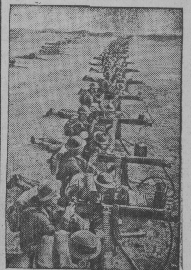
В Английской Армии. Занятия английских пулеметчиков. И. о. отв. ред. С. С. ОТИНОВА.

ЛОНДОН. РЕЙТЕР. Государственный департамент США объявил, что в исландских территориальных водах потоплен «Пинк Стар» водоизмещением в 6859 тонн, принадлежащий американскому правительству, плававший с панамским флотом.