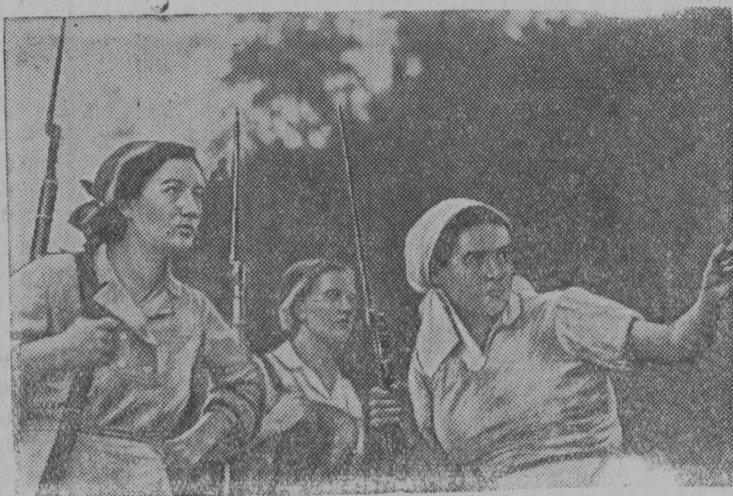
Партизанское движение стало грозной силой для фашистских разбойников. С каждым днем растет многочисленная армия вооруженных советских патриотов.

Куммёдз бригадаись сторож ёрт Е. П. Петров баитё: «Меным 70 год. Менам зонё защитайтё Родина, а ме тылын берегита колхозной добро, нянь шороммез. Отик килограмм нянь ог сет гусявны воррезлө. Этён ме отсала громитны врагёс.