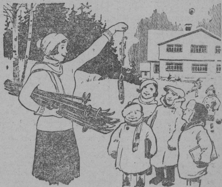
Рєбат а не забудте сдать зачет и по этим предметам

Okronolə kolə proveritnь etə čelosə da kulakəs vasətnь skolaiš.