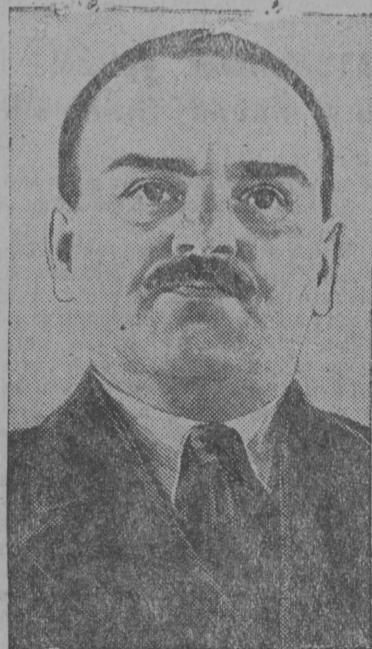
Ёрт Н. М. Шверник