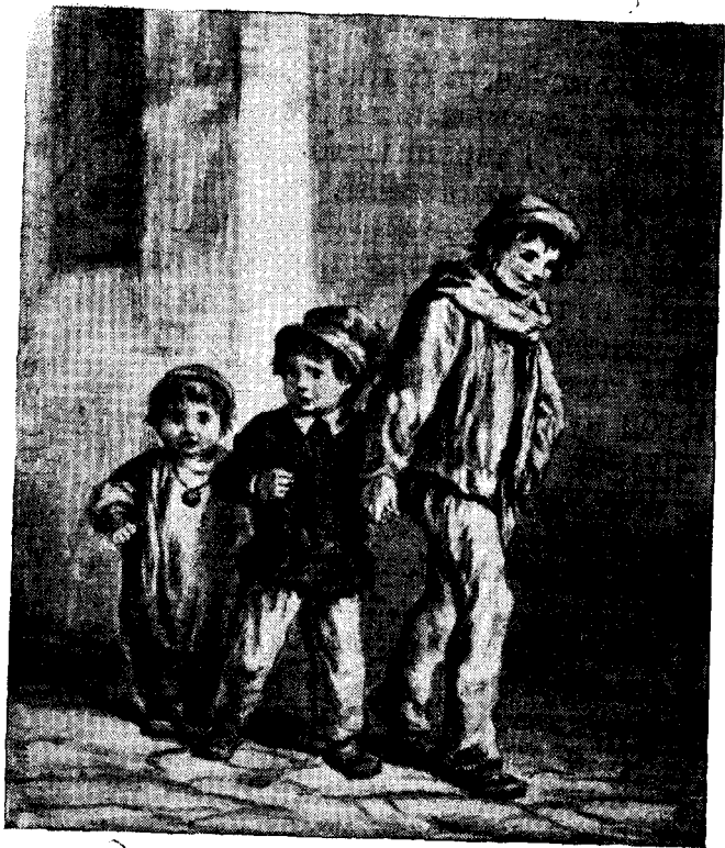
Челядыс веритӧмӧн мунисӧ Гаврош бӧрсянь