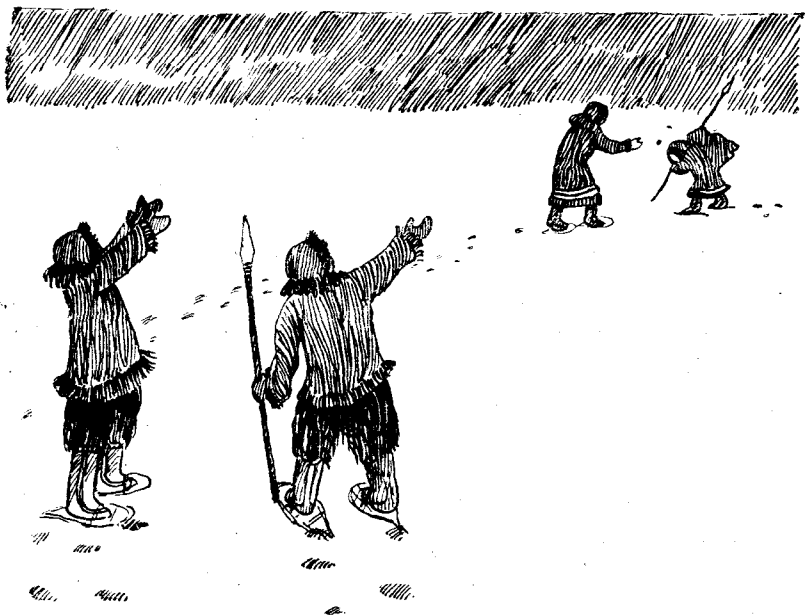
Киш бертіс славаэн.

Но чулаліс лун и ешэ лун. Куимэт лунас пондіс уннявны пурга, а Киш сё ешэ ез вэв. Айкига летіс ассне юренсэ и мавтіс чужэмсэ тюлень госісь саэн— етэн мэдіс мыччавны ассне горесэ; а инькаес видісэ мужиккесэ, кэритісэ нійэ, што нія съетшэм умэля