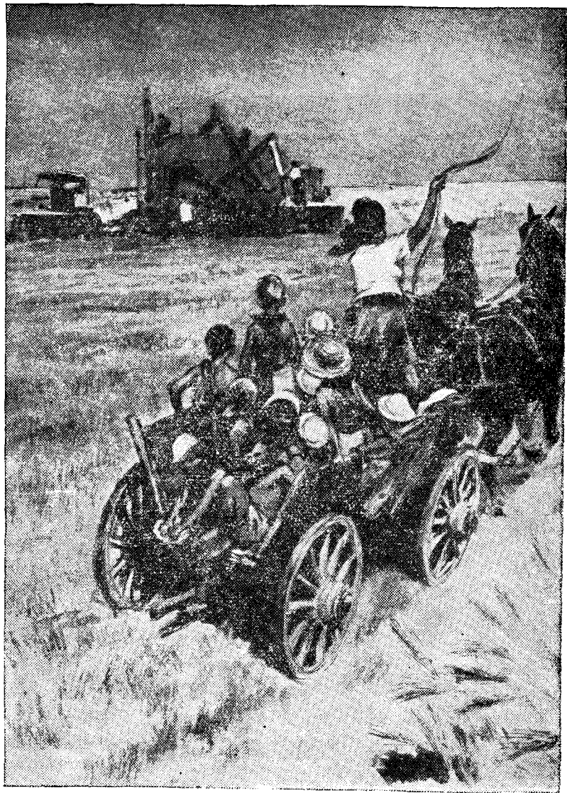
3. Степной шонді.