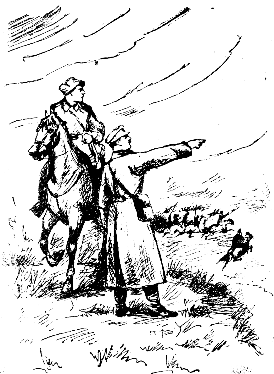
Ерттэз Сталин да Ворошилов фронт вылын Царицын увтын.