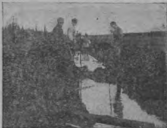
Кодјоны вануөдыг канава.

Та-бөрын мi төдам-һын, мыј һурын бур турун да һаң оз быдмыны мед-војдөр у васөд-понда. Му-