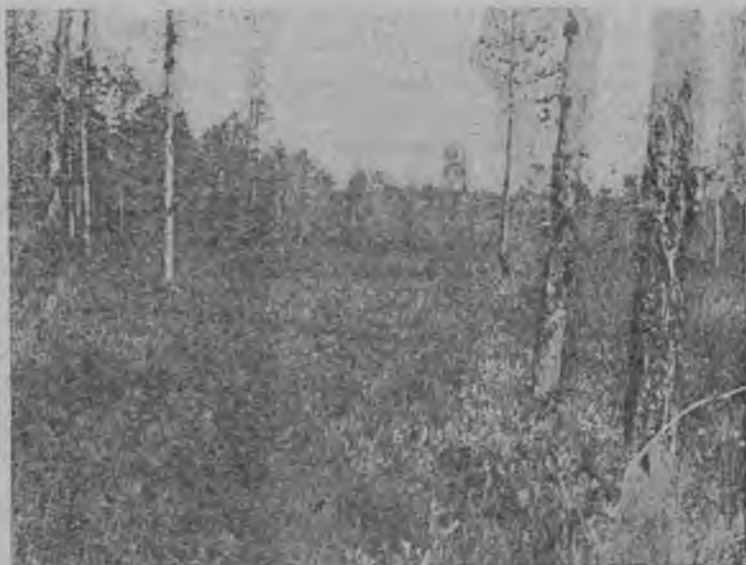
Увсөд нур Јемва-вожын.

Зер да лым ва керөс-вывјасыг летчө пыр улө. Зер ва летчө улө кык-ногөн: өти-кө, сјјө ісковтө,