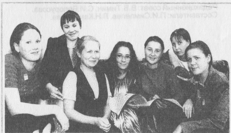
Гижысьяс да журналисьяс век ставсö вöчисны öтув.