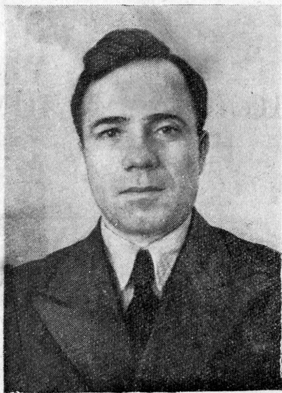
Portrait of [Name] [Title] [Date]