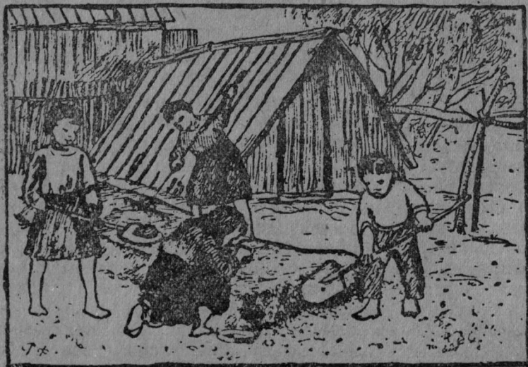
Школа дѣнса јѣрын

Совет соѣюзса гѣжысѣс ѡтувѣја соѣуз воса ужын жѣна чорѣїс, котырѣтѣс да ыжыда паскѣдѣс ассыс ужѣс. Мѣ зѣжа вермам шуны—велѣкѣй годовщѣна нубѣдѣ воса гырыс, зелалѣм сѣднѣ, ужалѣмлы славнѣй итѣгѣс. Нѣкор-на ез вѣвлы твор- чѣство перестроѣтѣм куѣта таѣдѣм зѣла ужалѣм. Советскѣй гѣжысѣс вѣчны даѣ кутасын вѣчны социализм странаѣса ыжыд лѣтература. Таѣдѣ тѣу вылын мѣжан ковмѣс боѣтны М. Горкѣйлыс озыр опытѣс, кодѣ уналатѣ мѣжан лѣтературалы лѣб образѣ- цѣн. М. Горкѣй медвоѣз петкѣдѣліс мѣжан пролетарскѣй художѣствоа лѣтератураын варварскѣй експлоатацијаѣс, адѣвлытѣм гѣллуныс да окурѣвскѣй бескультурѣжѣс жугыд, паскѣдѣ местаѣ, социалистичѣскѣй строѣй петан тѣу. „Мѣ кыпѣдам Горкѣйѣс кыѣ знамѣяѣс—шѣд СССР-са гѣжысѣс оргкомѣтетса јуралыс—медвоѣзѣс сы вѣс- на, мыѣ сѣїд асмаѣс заводѣтѣм пролетарскѣй лѣтература да морт сѣвман истѣрѣја социалистичѣскѣй ераѣса медвоѣзѣа гѣжыс, кодѣ шупѣдын сулалѣны сѣїс кыѣ заво- дѣтѣс да вѣчыс мѣвп да уж, кыѣ непов- торѣмѣй вѣтанѣяс—В. І. Лѣнин да І. В. Сталин“.