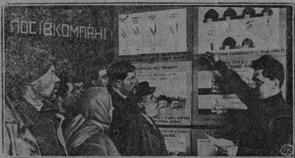
Агрономлыс лектсїја кывзöны.

Унжык јог-турун көјдысыс зев посні да гырыс тугјас-пыщыс оз зев і тыдав. Крестаніныд сесса і мөвпалö: төлөдчигас-пө-өд став төрїчаыс (јог-көјдысыс) бокö муніс, торјалис. Воқмөстчыс крестана төгөрвоісны-нын,—кіөн төлөдигөн он вермы став јог-турун көјдыс-сö торјөдны. Колö сы-бөрын нөшта-на весавны көјдыстө көјдыс ве-