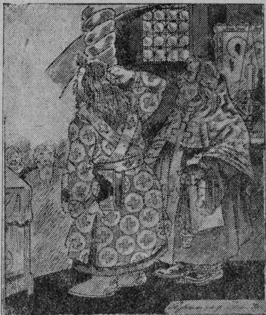
—душ даc кымын сөмын,—шуис факөн

— Но-о!—сувглөмөн збоја шуис факөн:—дыржык-кө мі таці нөшта комедјатө ворсны кутам, секи вот некытчө лоас воштыныд—шыбытасны бөкө, ортсө којыштасны јөгөс моз. Од позө-нын адзыны—релігјатө вицны некущом надежда абу, кыз шуоны „рано-мі поздно-мі“ еінасны сјөс выл јөз. Вот секи кытчө мі воштысам, отеч Пигірім?