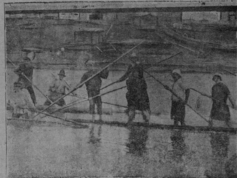
Ежва ју вывти Вомын сикт вестын вөтлөны мол бож.