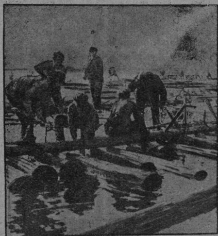
Позтыкерөсса брїгада вөр пур-јаланїнын.

Кујїм лун прамөја четчыны ег вермыв. Којмөд луннас четчі... Морт