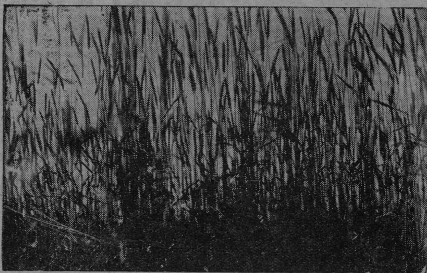
Нан ідралан кампаньӧ џоңнас вужӧдам сџельціна вылӧ

Ен адзывлӧј, Југыд нӧ гаж,— Кушӧм-нын тіјанлы Тӧдӧм да гаж! Шыгӧн унжыкыс Колминныд војассӧ, Нем мыреинныд, Кістӧнныд пӧс... Мыј чӧжывлӧс Содтӧдтор овмӧсад, Сіјӧс ӧктывлӧс, Ас џептас кӧжывлӧс Куџ јуреја быдлуңја гӧст.