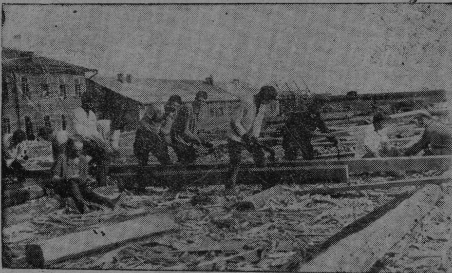
Ударнікјас робочіјјаслы стрөйтөны керка