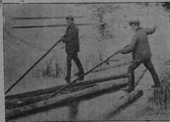
Улланаса велөдчысјас тојлалөны мол.