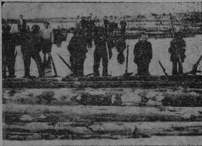
Кожгортса вөр участокын Визинга вөрпромхозын перјоны сибдөм пур.

— Мыј-кө тон лөас!..— Вомулас шуыштит ме бөроа Пила. — Ез ескө ков Киронидкөд венчынытө. Прамөј морт сижө. дөзмас. А сижө-кө дөзмас ставыс сы бөрса,