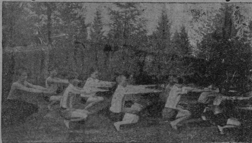
ОАХ-са шленјаслөн асја гимнастика .